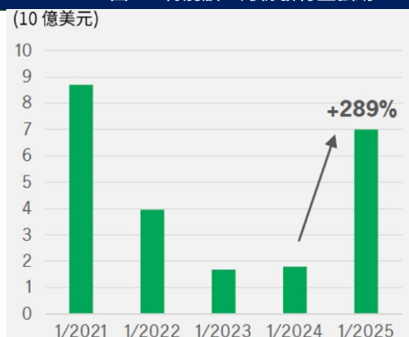
圖 2：特別股一月份發行量強勁

資料來源：Piper Sandler & Co.及 Morgan Stanley 截至 2025 年 1 月 31 日。